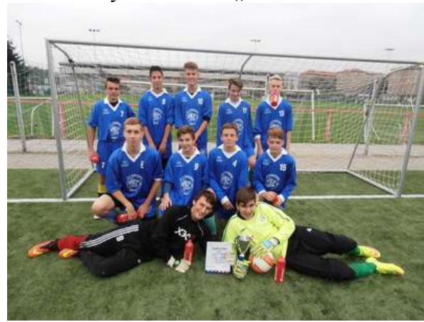
Soutěž v minifotbale v Edenu