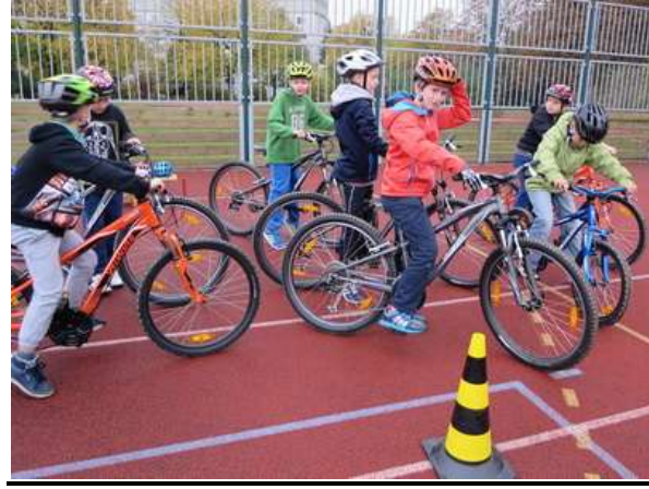
Bezpečně na kole - 21. října