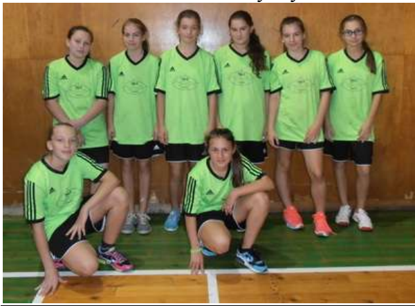
Turnaj dívek v přehazované