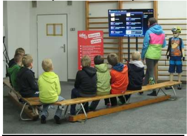
Výuka teorie v „hemžárně“