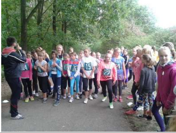
Prespolní běh v Hostivaři - 24.září