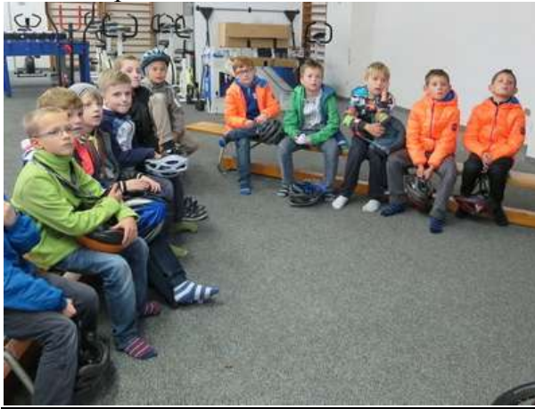
Teoretická část výuky